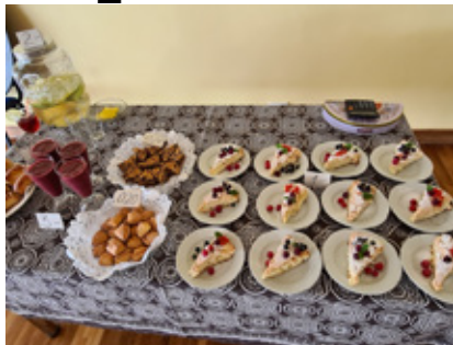
А в кафе людям были предложены: