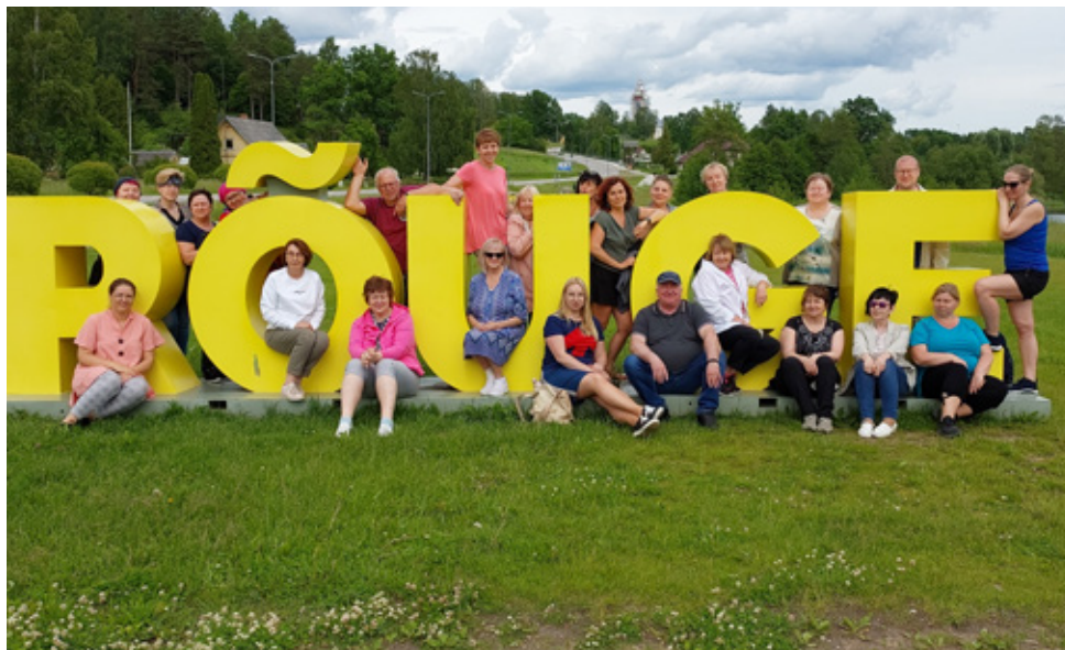
Поездка учителей Кундаской школы.