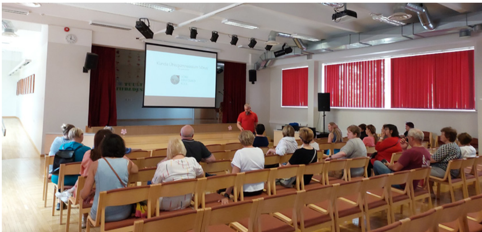
Учителя Кундаской школы в гостях у школы Выру Креутзвальд.