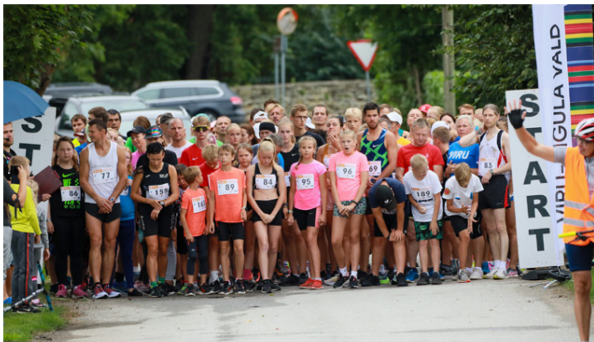
Старт основного и молодежного забегов.