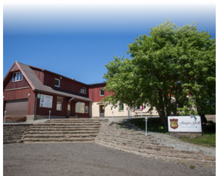
Дома общества.